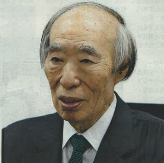
さかぐち・ちから 三重県立大（現三重大）医学部卒。1972年の衆議院議員選挙で初当選し、医師から政界へ転身。93年労働相、2001年初代の厚生労働相などを歴任。12年政界を引退、16年から「免疫の力でがんを治す患者の会」の会長。医学博士。三重県出身。83歳。

「医療現場ではまだまだ新しい治療法に対する拒否反応がある。役所も同様だ。医師の責任で自由診療を行っているのが現状だ。近年、免疫チェックポイント阻害剤の開発や、免疫療法と遺伝子療