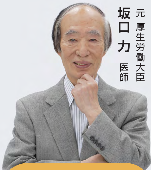
元厚生労働大臣 坂口力 医師