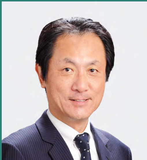
後藤 重則 医師 (瀨田クリニック東京院長) 順天堂大学客員教授

1960年三重県立大学(現国立三重大学)医学部卒業。1965年同大学大学院医学研究科修了。医学博士。 三重県赤十字血液センター所長を経て1972年衆議院議員に初当選。2001年初代厚生労働大臣に就任(2004年まで)。2016年9月「免疫の力でがんを治す患者の会」設立