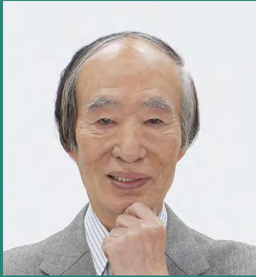
坂口 力 医師 (「免疫の力でがんを治す患者の会」会長) 元厚生労働大臣

1960年三重県立大学(現国立三重大学)医学部卒業。1965年同大学大学院医学研究科修了。医学博士。 三重県赤十字血液センター所長を経て1972年衆議院議員に初当選。2001年初代厚生労働大臣に就任(2004年まで)。2016年9月「免疫の力でがんを治す患者の会」設立