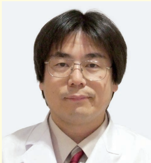
水腰 英四郎 医師 医学博士

1960年三重大学医学部卒業。1965年同大学院医学研究科修了。医学博士。1969年三重県赤十字血液センター所長。1972年衆議院議員初当選。2001年初代厚生労働大臣就任。2016年「免疫の力でがんを治す患者の会」設立、会長就任。東京医科大学総合医療研究講座特任教授